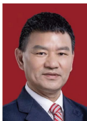
大会主席 谭蔚泓 院士